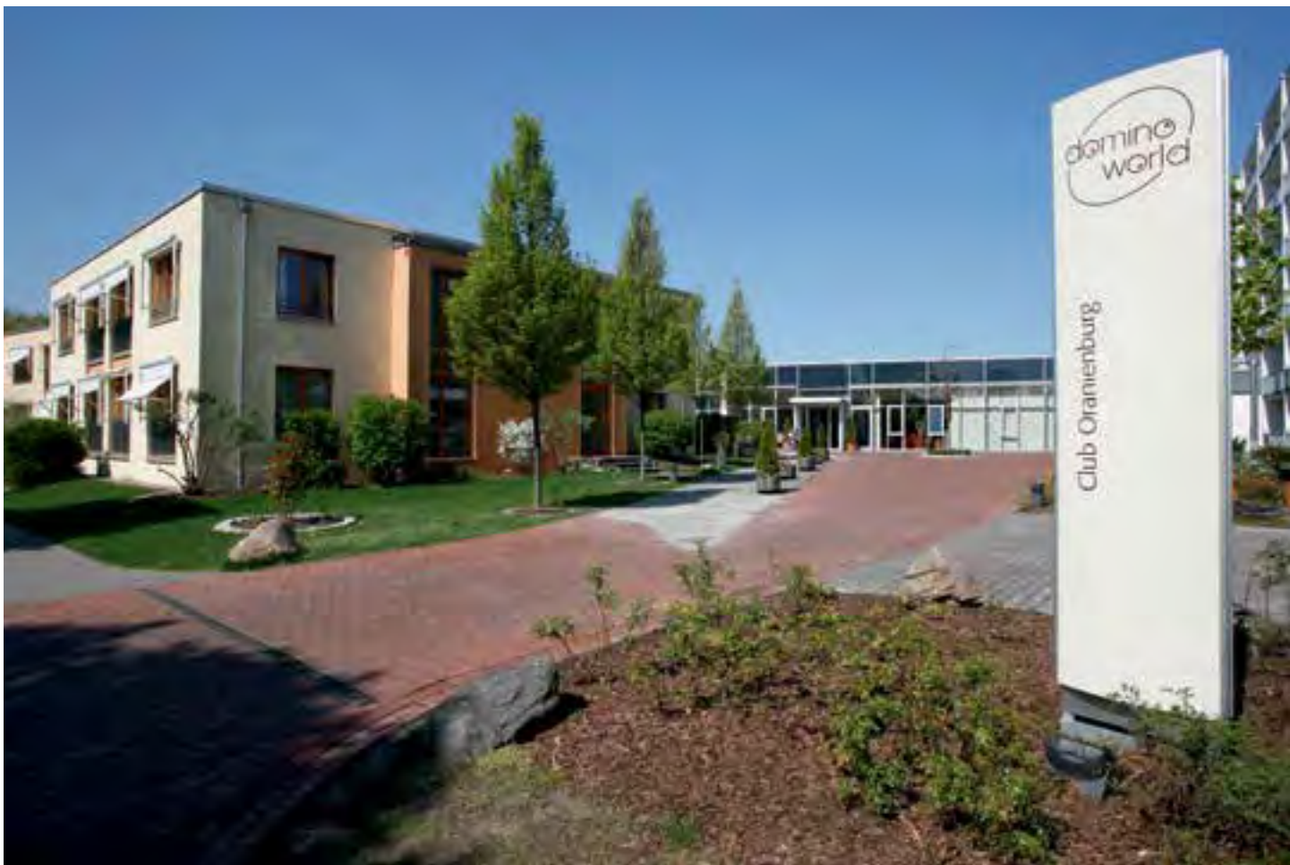
Der domino-world™ Club Oranienburg

Das Instrument „Wissensbilanz – made in Germany“ des Fraunhofer Instituts ermöglicht jedem Anwender über das Sichtbarmachen des intellektuellen Kapitals hinaus eine fundierte Priorisierungsmöglichkeit von Prozessverbesserungen – damit wird die Wissensbilanz zum „Motor“ von Entwicklung und Fortschritt im Unternehmen.